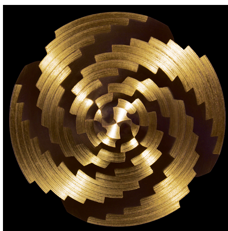
Technisches Highlight des Stufenbohrers: Kraftverteilung auf vier Schneiden