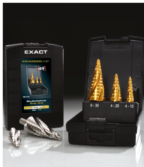
Die Stufenbohrerbox von EXACT

Eine weitere Neuheit und Besonderheit des ADVANCEDLine by EXACT-Stufenbohrers ist die speziell entwickelte „Turbo-Spitze“. Sie bietet ein stark vereinfachtes Zentrier- und Anbohrverhalten. Dadurch wird das Verrutschen des Bohrers auf dem Material verhindert – ein „Ankönnen“ ist somit nicht mehr notwendig. Optional bietet der Remscheider Hersteller seine neueste Innovation auch mit dem patentierten ROTASTOP-Schaft an, der aufgrund seiner Form ein Durchdrehen des Bohrers im Bohrfutter verhindert und so jederzeit eine optimale Drehmomentübertragung gewährleistet. [hw]