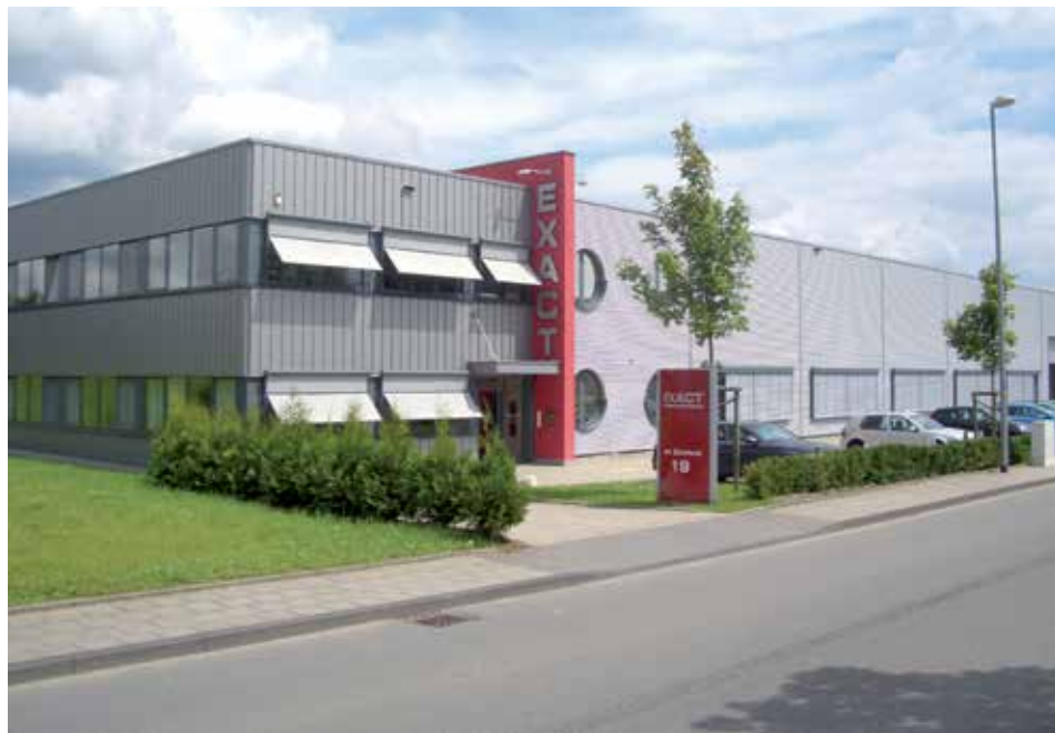
Exact Präzisionswerkzeuge est implanté à Remscheid, dans un bâtiment comportant 5 000 m 2 pour les ateliers et 1 500 m 2 pour la logistique. Les livraisons arrivent en J+2 en France pour tous les articles en stock.

pour leur part fabriqués en Asie à travers un partenariat technologique établi de longue date (28% des ventes).