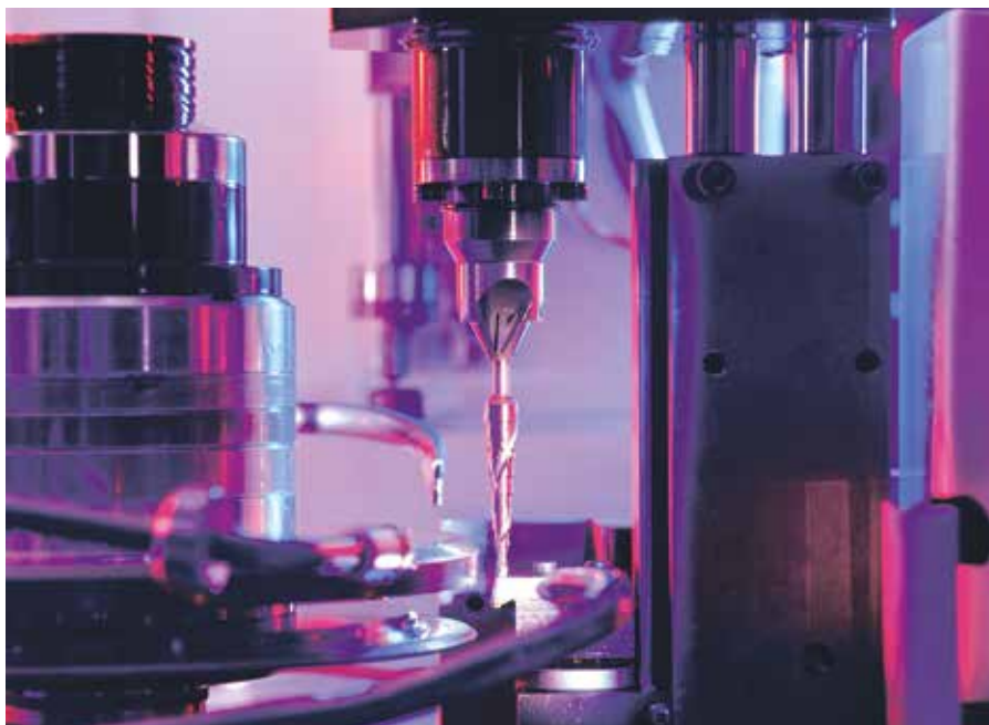
Détail de la fabrication du foret étagé STB. La société Exact fabrique en autonomie d'énergie 1,6 million d'outils coupants dans son usine de Remscheid.

Cette politique engagée en Allemagne et divers pays européens est déclinée en France depuis 2021 avec la mise en place d'un véritable projet